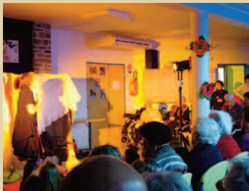
Coquelicot aux Nadauds 30/05/2013